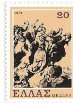
VI.1415: Choros tou Zalongou

VI.1147: Het beleg van Athene 1826 – 1827: Na maandenlange gevechten, onenigheid onder de kleften en onthutsende misverstanden tussen de geallieerde bevelhebbers verlieten op 5 juni 1827 ruim 2000 verdedigers de Akropolis om door Franse schepen te worden ontzet. De Akropolis was weer Turks!