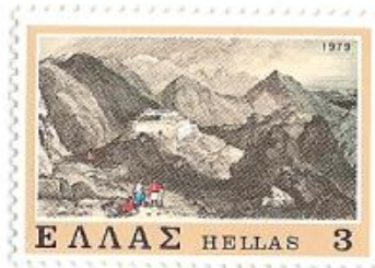
VI.1413: Kasteel van Souli