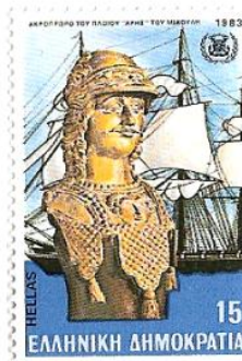
VI.1571: De “Ares” van Miaoulis met boegbeeld.

VI.1136: Zeeslag bij Gerontas. Op 29 augustus 1824 versloeg de Griekse vloot, bestaande uit 75 schepen van Hydra, Spetses en Psara, onder leiding van Andreas Miaoulis een schijnbare overmacht van 400 Turkse, Egyptische en Tunesische schepen vlakbij het eiland Leros.