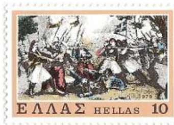
VI. 1414: Soulioten op het slagveld