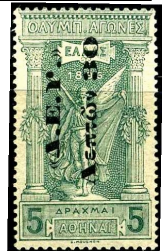
5 Dr met opdruk 30 Lepta, opgebruik als fiscaal zegel