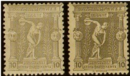
de 10 en 20 Lepta in verschillende kleurnuances

Volgens een publicatie in Le Timbre Poste op 19 maart 1896 bleven de aangeleverde aantallen van de laagste waarden tot en met de 20 Lepta ver achter bij wat eerder was besteld. Er is geen aanwijzing, dat er vervolgoeddrachten nodig waren voor de overige waarden.