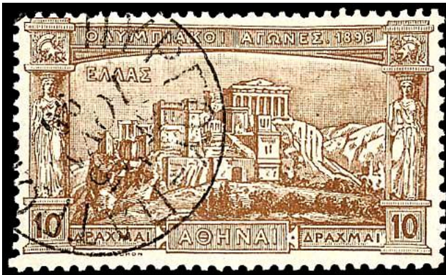
Een zeldzaam stempel op de 10 Drachme: het treinstempel Pyrgos-Patras

vooral bij de 2 Drachmen in het oog springen (niet te verwarren met de vervalsing!), zouden het gevolg zijn van verschillende manieren waarop de drukplaten van inkt werden voorzien. Dat heeft tot gevolg, dat ook bij zegels van andere waarden uit één en dezelfde oplage kleurnuanceverschillen kunnen voorkomen.