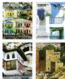
1. Γραμματόσημα / Stamps Τιμή / Price: 3,14 €