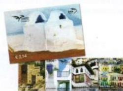
4. Τευχίδια / Booklets Τιμή / Price: 3,14 €