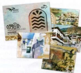
Σετ 4 Αριθμημένων Φυλλακικών Set of 4 numbered Souvenir Sheets Τιμή / Price: 3,14 €