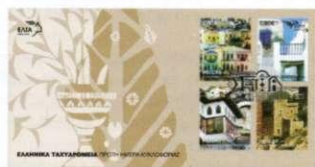
2. Φάκελος Πρώτης Ημέρας Κυκλοφορίας First Day Cover Τιμή / Price: 4,50 €