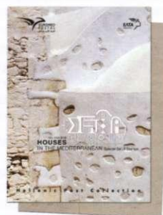
3. Απλό Άλμπουμ Γραμματοσήμων Regular Set Album Τιμή / Price: 12,00 €