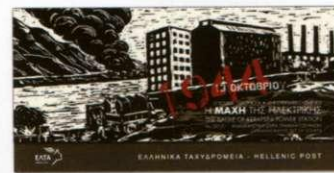
3. Τυποποιημένη σειρά γραμματοσήμων Set pack Τιμή / Price: 4,10 €