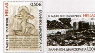
1. Γραμματόσημα / Stamps Τιμή / Price: 1,50 €