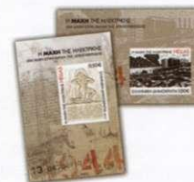
5. Αριθμημένα Φυλλαράκια Souvenir sheets Τιμή σετ/ Price per set: 1,50€