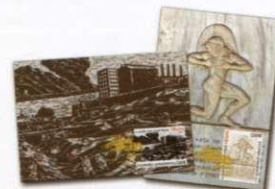
6. Κάρτες Μάξιμουμ Prepaid Prepaid maximum cards Τιμή σετ/ Price per set: 3,20 €