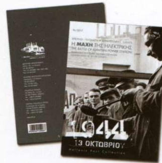
4. Απλό άλμπουμ γραμματοσήμων Regular set album Τιμή / Price: 7,30 €