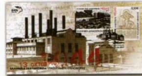
2. Φάκελος Πρώτης Ημέρας Κυκλοφορίας First Day Cover Τιμή / Price: 2,50 €