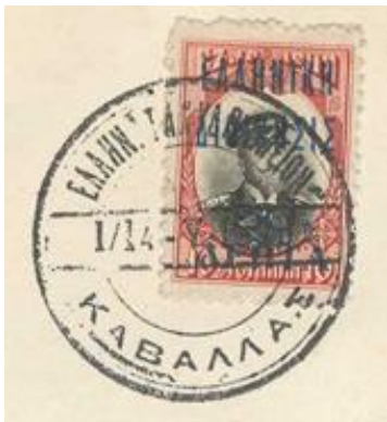
Variant I, Stadium I

Opmerkelijk daarbij is dat Tocco in zijn artikel in Philotelia opmerkt dat variant II (met de maandaanduiding voluit in Griekse letters) op 15/28 juli in gebruik werd genomen. 9 Dat zou betekenen dat zegels met het stempel 1/14 IOYAI OY 13 per definitie achteraf zijn gestempeld.