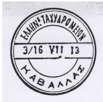
Variant I, Stadium II