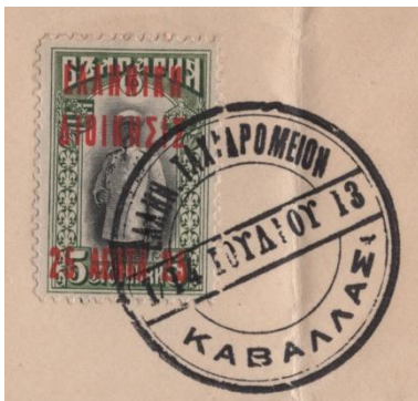
Variant II, Stadium I