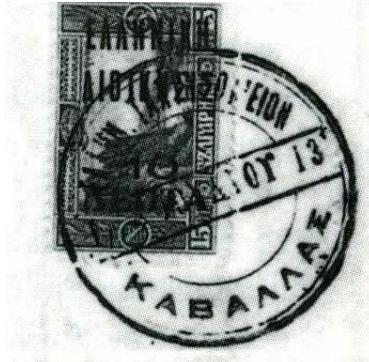
Variant II, Stadium II